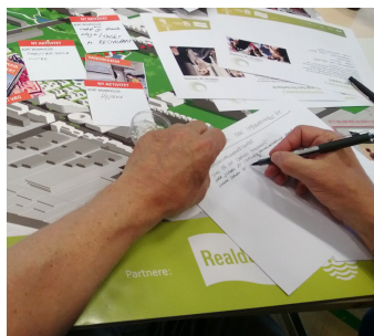
Billede 1. Der arbejdes på kvarterløft med urban farming i Gellerup og Toveshøj.

Nok så væsentligt er det imidlertid, at omgivelserne skal dyrkes og fødevarerproduktionen skal ske på beboernes præmisser. Derfor har Videncentret for Landbrug været med til workshops, hvor boligrådets fremtid er blevet drøftet. Der har været en interesse for urban farming tænkt sammen med de øvrige elementer og aktiviteter i bydelen, fordi fødevarerproduktion netop kan facilitere og tilføje disse en merværdi. Videncentret for Landbrug er desuden også valgt som fortsat samarbejdspartner.