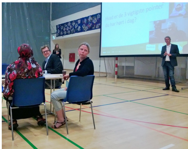
Billede 5. Beboerrepræsentant lytter opmærksomt mens guld-kornene samles ind.

Løbende blev der samlet op på piloternes tanker og idéer, og forståelsen for urban farmings potentialer voksede og slog rod, efterhånden som begrebet blev foldet ud og sat ind i en større sammenhæng.