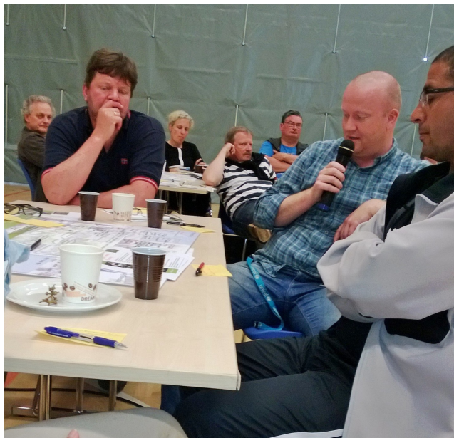
Billede 4. Piloter forklarede perspektiverne i deres forslag.

Nuværende og kommende brugere, interessenter og eksperter har fået mulighed for at bidrage med input og gode ideer til indholdet af konkurrencen om udformningen af fremtidens byrum i Gellerup og Toveshøj. Til den første workshop var der udvalgt omkring 60 piloter. Idéer og erfaringer fløj over bordene, der var grupperet om temaer som sundhedshus, sports- og kulturcampus og fremtidige gade, plads- og landskabsrum, som sikrer naturlig sammenhæng og synergier mellem sport, uddannelse, beskæftigelse, fritid, erhverv, boliger mm.