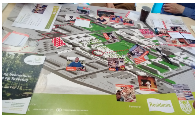
Billede 7. Videncentret for Landbrug kvalificerer, hvor urban farming kortet med fordel kan plantes på oversigtskortet.

Her var de mange indsamlede idéer transformeret til små kort, som i grupper skulle placeres på et oversigtskort over Gellerupparken og Toveshøj. Det forhindrede dog ikke de fremmødte i at fortsætte idégenereringen, og urban farming blev medtænkt i endnu flere byrumskonstellationer. Men nok så vigtigt viste øvelsen, at byrummet til stadighed bør give plads til mangfoldighed og udviklingen af nye idéer.