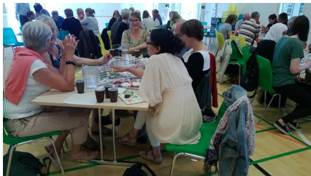
Billede 6. Det diskuteres hvor fx urban farming med størst mulig virkning kan placeres i den nye bydel.

Her var de mange indsamlede idéer transformeret til små kort, som i grupper skulle placeres på et oversigtskort over Gellerupparken og Toveshøj. Det forhindrede dog ikke de fremmødte i at fortsætte idégenereringen, og urban farming blev medtænkt i endnu flere byrumskonstellationer. Men nok så vigtigt viste øvelsen, at byrummet til stadighed bør give plads til mangfoldighed og udviklingen af nye idéer.